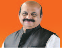
ಶ್ರೀ ಬಸವರಾಜ ಎಸ್. ಬೊಮ್ಮಾಯಿ ಸರ್ಕಾರ ಮುಖ್ಯಮಂತ್ರಿಗಳು