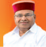
ಶ್ರೀ ಥಾವರ್ ಚಂದ್ ಗಡ್ಕೋಟ್ ಸರ್ಕಾರ ರಾಜ್ಯಪಾಲರು