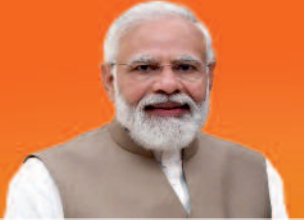
ಶ್ರೀ ನರೇಂದ್ರ ಮೋದಿ ಸರ್ಕಾರ ಪ್ರಧಾನಮಂತ್ರಿಗಳು