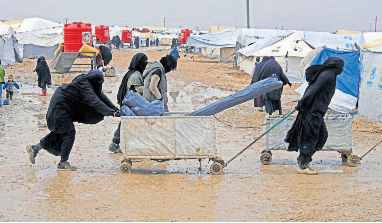
ಪುನರ್ವಸತಿ ತಿಬರದಲ್ಲಿ ಐಸಿಸ್ ಉಗ್ರರ ಕುಟುಂಬಸ್ಥರು

ಕು ರುಕ್ಷೇತ್ರದ ಸ್ಮಶಾನದಲ್ಲಿ ಯಕ್ಷಿಣಿಯರು ಯುದ್ಧದ ಭೀಕರತೆಯನ್ನು ಚರ್ಚಿಸುವ ಕಥೆ ಕೇಳಿದ್ದೇವೆ. ಮಹಾಭಾರತದ ಆ ಸನ್ನಿವೇಶವೇ ಕುವೆಂಪು ಅವರ 'ಸ್ಮಶಾನ ಕುರುಕ್ಷೇತ್ರಂ' ನಾಟಕದ ಕಥಾವಸ್ತು.