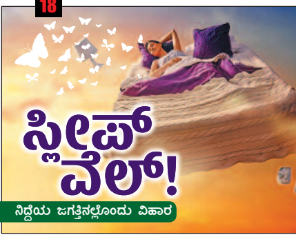
ನಿಧ್ಯಯ ಜಗತ್ತಿನಲ್ಲೊಂದು ವಿಹಾರ

ಊಟ ಬಲ್ಲವನಿಗೆ ರೋಗವಿಲ್ಲ ಎನ್ನುವ ಮಾತು 'ನಿಧ್ಯ'ಗೂ ಹೊಂದುವಂತಹದ್ದು. 'ನಿಧ್ಯ' ಬಲ್ಲವನಿಗೆ ರೋಗವಿಲ್ಲ' ಎನ್ನುವ ಮಾತು, ನಿಧ್ಯಯನ್ನು ಒಂದು ಕಲೆಯಾಗಿ ನೋಡಲು ಒತ್ತಾಯಿಸುತ್ತದೆ. ನಮ್ಮಲ್ಲಿ ಅನೇಕರ ಪಾಲಿಗೆ ನಿಧ್ಯಯನ್ನುವುದು ಒಂದು ಯಾಂತ್ರಿಕ ಕ್ರಿಯೆ. ನಿಧ್ಯ ಯಾವಾಗ ಮಾಡಬೇಕು ಹಾಗೂ ಎಷ್ಟು ಮಾಡಬೇಕು ಎನ್ನುವುದರ ಅರಿವು ಆರೋಗ್ಯಭಾಗ್ಯದ ಕೀಲಿಕೆ. ಉತ್ತಮ ನಿಧ್ಯ ಶಿಸ್ತಿನ ಜೀವನಶೈಲಿಯ ಭಾಗವಾಗಿರುತ್ತದೆ. ನಿಧ್ಯಯ ಹಲವು ಸಾಧ್ಯತೆಗಳನ್ನು ಚರ್ಚಿಸುವ ಈ ಬರಹ, ನಿಧ್ಯಾರೋಕವನ್ನು ಕುರಿತಂತೆ ನಮಗೆ ತಿಳಿಯದ ಅನೇಕ ಸಂಗತಿಗಳ ಬಗ್ಗೆ ಬೆಳಕು ಚೆಲ್ಲುತ್ತದೆ.