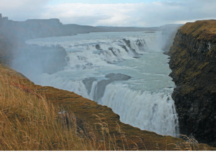
ರುದ್ರರಮಣೇಯ 'ಗಲ್ಪಾಸ್' ಜಲಪಾತ

'ಡೈಮಂಡ್ ಬೀಚ್' ತೀರದಲ್ಲಿ ವಜ್ರದ ತುಣುಕುಗಳಂತೆ ಗೋಚರಿಸುವ ಮಂಜುಗಡ್ಡೆಗಳು