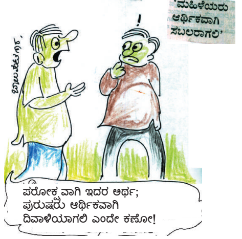
ಪರೋಕ ವಾಗಿ ಇದರ ಅರ್ಥ; ಪುರುಷರು ಆರ್ಥಿಕವಾಗಿ ದಿವಾಳಿಯಾಗಲಿ ಎಂದೇ ಕಪೋ!