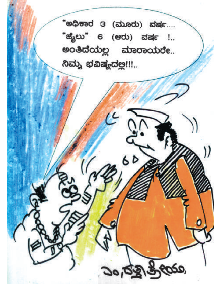
ಅಧಿಕಾರ 3 (ಮೂರು) ವರ್ಷ... "ಜೈಲು" 6 (ಆರು) ವರ್ಷ!.. ಅಂತಿದೆಯಲ್ಲ ಮಾರಾಯರೇ.. ನಿಮ್ಮ ಭವಿಷ್ಯದಲ್ಲ!!!