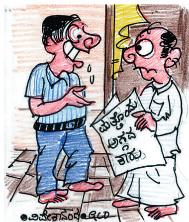
ಮಾವ ವರದಕ್ಕೆ ಕೈಯಲ್ಲಿ ಕಾರೇನೂ ಬೇಡ. ನಾನೇ ತಗೊಳ್ಳಿ. ಪ್ರತಿದಿನ ಕಾರಿಗೆ ಪೆಟ್ರೋಲ್ ಹಾಕಿಸ್ಕಿಡಿ ಸಾರ್...