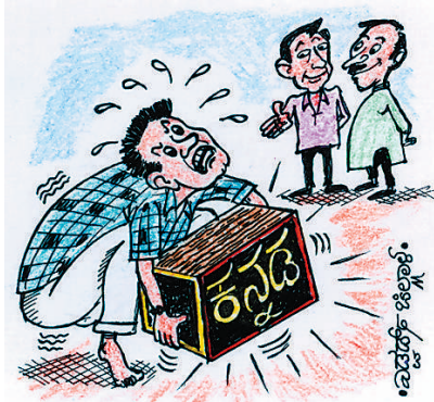
ಕನ್ನಡವನ್ನು ಮೇಲೆತ್ತುವ ಕೆಲಸ ಆಗಬೇಕಾಗಿದೆ ಅಂತಿದ್ದಲ್ಲಾ? ನೋಡಿ ಆ ಕೆಲಸ ಭರದಿಂದ ಸಾಗಿದೆ!