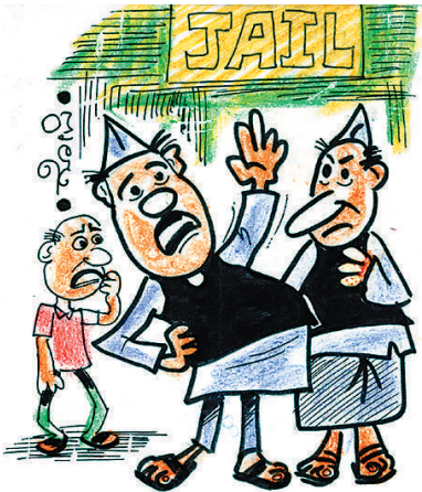
ಇನ್ನು ಜೈಲುಗಳ ಗುಣಮಟ್ಟ ಏರಿಸಲೇ ಬೇಕು. ಯಾವಾಗ ನಾವು ಹೋಗ್ತೀವೋ ಗೊತ್ತಿಲ್ಲ!