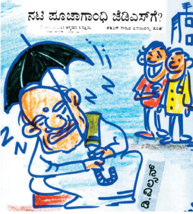
ಯಾವಾಗ 'ಮುಂಗಾರು ಮಳೆ' ಸುರಿಯುತ್ತೆ ಅಂತ ಹೇಳಕ್ಕಾಗಲ್ಲವಲ್ಲ.. ಅದೈ...