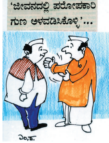
ನೀವು ಅಧಿಕಾರದಲ್ಲಿದ್ದಾಗ ನಮಗೆ ಸಹಾಯ ಮಾಡೋದು! ನಾವು ಅಧಿಕಾರದಲ್ಲಿದ್ದಾಗ ನಿಮಗೆ ಸಹಾಯ ಮಾಡೋದು! ಇದೇ ಗುಣ ಎಲ್ಲಿಗೂ ಇರಬೇಕಾಗಿರೋದು...