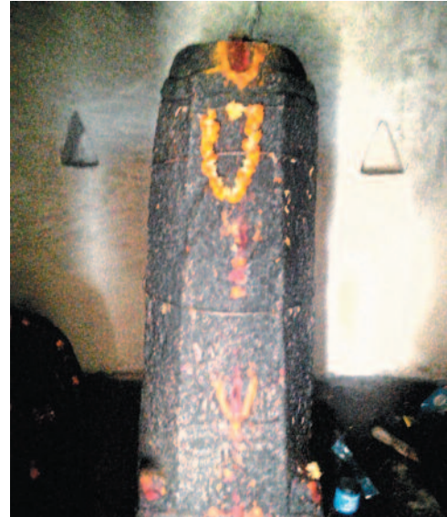
ಬೆಟ್ಟದ ಶಿಖರದಲ್ಲಿನ ಈ ಸ್ತಂಭಕ್ಕೆ ರಾಮನ ಅಶ್ವಮೇಧದ ಕುದುರೆಯನ್ನು ಕಟ್ಟಿದ್ದರೆಂಬ ನಂಬುಗೆ.