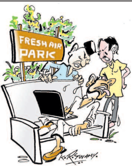
ಮೂರು ಪೈತಾ A.C. ಅರ್ರಾ ನಾ... ಈ ಗಾಳಿ ಅವನಿಗೆ ಆಗಿ ಬರಲ್ಲ...

ತಂದೆ: ಮಗಳೇ ನಿನಗೆ ಯಾವ ತರಹದ ಗಂಡು ಬೇಕು? ಮಗಳು: ತುಂಬಾ ತಾಳ್ಮೆ ಇರುವಂತಹ ಗಂಡು ಬೇಕಪ್ಪ. ತಂದೆ: ಆರ್.ಸಿ.ಬಿ ಫ್ಯಾನ್ ಆದ್ರೆ ಆಗುತ್ತೇನಮ್ಮಾ.