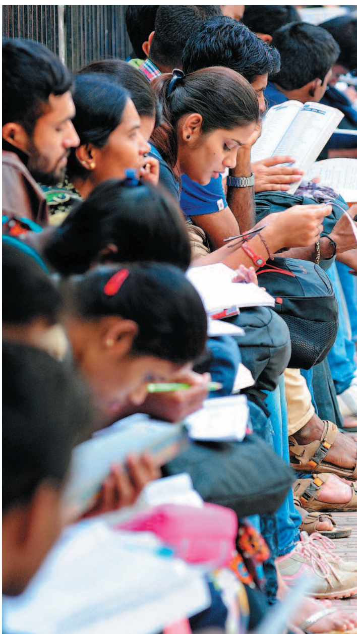
ಚಿತ್ರ: ರಂಜು ಪಿ.

ರೀತಿ ಜೊತೆಗೆ ಅಪ್ಪ—ಅಮ್ಮಂದಿರೊಂದಿಗೆ ಮಕ್ಕಳಿಗೆ ಸಿಗಲೇಬೇಕಾದ ಸಾಕಷ್ಟು ಸಮಯ— ಹಾಗೂ ಮುಕ್ತ ಸಂವಹನ. ಒತ್ತಡ ಯಾವ್ಯಾವುದರಿಂದ? ವಿದ್ಯಾರ್ಥಿಗಳ ಒತ್ತಡದ ಕಾರಣಗಳನ್ನು ಹೀಗೆ ಪಟ್ಟಿ ಮಾಡಬಹುದು: ಶೈಕ್ಷಣಿಕ: 4 ಶಾಲೆಯ ಓದು, ಮನೆಯಲ್ಲಿ ಓದು, ಅತಿಯಾದ ಹೋಂವರ್ಕ್ ಹೊರೆ, ಕಲಿಕೆಯಲ್ಲಿ ತೊಂದರೆ. ಭಾವನಾತ್ಮಕ: 4 ಕೌಟುಂಬಿಕ: ತಲೆಮಾರಿನ ಅಂತರ, ಸಂವಹನದ ಸಮಸ್ಯೆ, ಅಪ್ಪ—ಅಮ್ಮಂದಿರಿಗೆ ಸಮಯವಿರದಿರುವುದು. 4 ಶಾಲೆ: ಶಾಲಾ ಬದ್ಧಾಳಿಕೆ, ಶಿಕ್ಷಕರೊಡನೆ ಗುದ್ದಾಟ, ಅತಿ ಶಿಸ್ತು 4 ಸ್ನೇಹಿತರು: ಸ್ನೇಹಿತರೊಡನೆ ಹೊಂದಾಣಿಕೆಯ ಸಮಸ್ಯೆಗಳು, ಅತಿ ಗೆಲೆತನ . ಎದುರಿಸುವುದು ಹೇಗೆ?