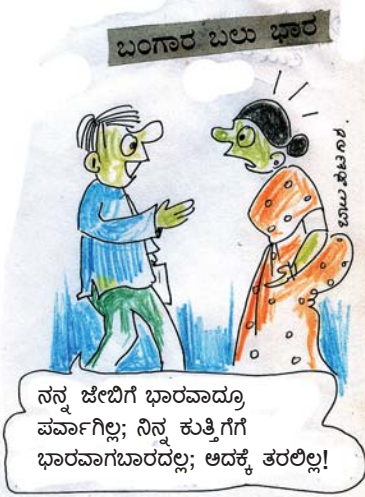
ನನ್ನ ಜೇಬಿಗೆ ಭಾರವಾದ್ದೂ ಪರ್ವಾಗಿಲ್ಲ; ನಿನ್ನ ಕುತ್ತಿಗೆಗೆ ಭಾರವಾಗಬಾರದಲ್ಲ; ಅದಕ್ಕೆ ತರಲಿಲ್ಲ!