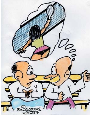
ಆಟ ತಿಳಿಯದಿದ್ದೂ ಮಹಿಳೆಯರ ಟೆನಿಸ್ ತವ್ವದೇ ನೋಡೋಣ!