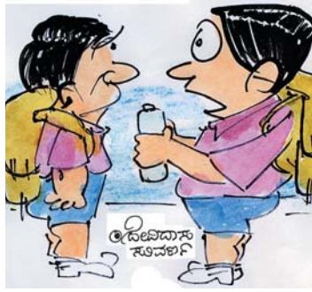
ಹಾಲು ತುಟ್ಟಿಯಾಗಿದೆ, ಶಾಲೆಯಲ್ಲಿ ಕುಡಿಯದೇ ಮನಗೇ ತಾ ಎಂದಿದ್ದಾರೆ ಅಮ್ಮ!