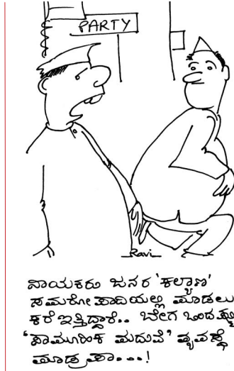
ಪಾಯಕರು ಸುನರ 'ಕಲ್ಯಾಣ' ಸಮಕೋ ಹಾಕಿಯಲ್ಲ ಮೊಡಲು ಕಲೆ ಇತ್ತಿದ್ದಾರೆ.. ಇವೆದ್ದ ಇಂದಕ್ಕೆ 'ಶೋಮುಗಿಂಕ ಮನುವೆ' ವ್ಯವಸ್ಥೆ ಮಾಡುತ್ತಾರೆ...!