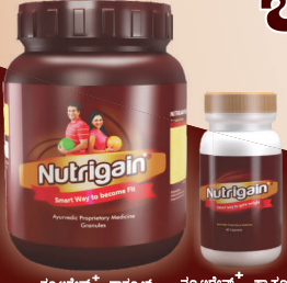
ನ್ಯೂಟ್ರಿಗೇನ್ + ಗ್ರಾನುಲ್ಸ್ ನ್ಯೂಟ್ರಿಗೇನ್ + ಕ್ಯಾಪ್ಸೂಲ್ಸ್

ನೀವು ನ್ಯೂಟ್ರಿಗೇನ್‌ನ ಸದುಪಯೋಗ ಪಡೆದಿದ್ದಲ್ಲಿ ನಿಮ್ಮ ಇತ್ತೀಚಿನ 3 ರಿಂದ 4 ಆಕರ್ಷಕ ಭಾವಚಿತ್ರವನ್ನು ಕೆಳಹಿನ್ನೆ ನ್ಯೂಟ್ರಿಗೇನ್ ಜಾಹೀರಾತಿನಲ್ಲಿ ಬರುವ ಅವಕಾಶ ಕೆಲಸಿಸಿಕೊಳ್ಳಿ.