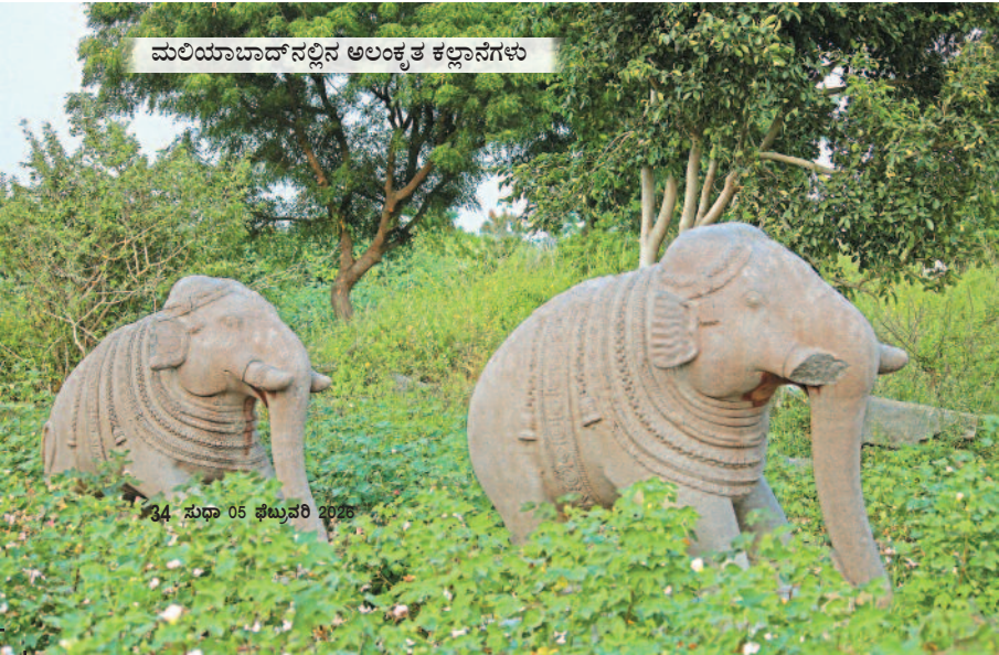
ಮಲಿಯಬಾದ್‌ನಲ್ಲಿನ ಅಲಂಕೃತ ಕಲ್ಲಾನೆಗಳು

ರಾಯಚೂರನ್ನು ಹಿಂದುಳಿದ ಪ್ರದೇಶವೆಂದು ಕರಿಬ್ಯಾಡಿ ಅಂತ ಮಾಜಿ ರಾಷ್ಟ್ರಪತಿ ಅಬ್ದುಲ್ ಕಲಾಂ ಅವರ ಹೇಳಾರ ನೋಡಿ. ಅವು 2013ರಾಗ ವಿದ್ಯಾರ್ಥಿಗಳ ಜೊತೆ ಸಂವಾದದಾಗ ಮಾತಾಡಕಲ್ಲ ರಾಯಚೂರು ಪ್ರದೇಶವು ಹಿಂದುಳಿದ ಎಂಬ ಮಾತಿಗೆ ಕಲಾಂ ಅವರು ಬಹಳ ಚೆಂದ್ ಆಗಿ ಹಿಂಗ ಹೇಳಾರ... 'ನೀವು ಸುಳ್ಳು ಹೇಳಬೇಡಿ, ಈ ಪ್ರದೇಶ, ಇಲ್ಲಿಯ ಹುಡುಗರು ಕೇಳುವ ಪ್ರಶ್ನೆಗಳು, ಅವರ ಆಸಕ್ತಿಯು ನಮ್ಮ ದಿಲ್ಲಿಯ ಯಾವ ವಿಶ್ವವಿದ್ಯಾಲಯ, ಕಾಲೇಜುಗಳಲ್ಲೂ ಇಲ್ಲ, ನೀವು ಎಂದಿಗೂ ಈ ಪ್ರದೇಶವನ್ನು ಹಿಂದುಳಿದಿದೆ ಎಂದು ಹೇಳಬೇಡಿ, ಇದು ನನ್ನ ಆರ್ಡರ್!'