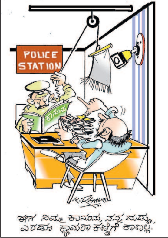
ಈಗ ನಿಮ್ಮ ಕಾನೂನು, ನನ್ನ ಮದ್ದು, ಎರಡೂ ಕೈಮರ ಕಟ್ಟಿಗೆ ಕಾಣಲ್ಲ.