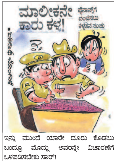
ಇನ್ನು ಮುಂದೆ ಯಾರೇ ದೂರು ಕೊಡಲು ಬಂದ್ರೂ ಮೊದ್ಲು ಅವರನ್ನೇ ವಿಚಾರಣೆಗೆ ಒಳಪಡಿಸಬೇಕು ಸಾರ್!