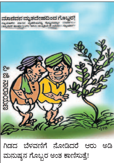
ಗಿಡದ ಬೆಳವಣಿಗೆ ನೋಡಿದರೆ ಆರು ಅಡಿ ಮನುಷ್ಯನ ಗೊಬ್ಬರ ಅಂತ ಕಾಣಿಸುತ್ತೆ!