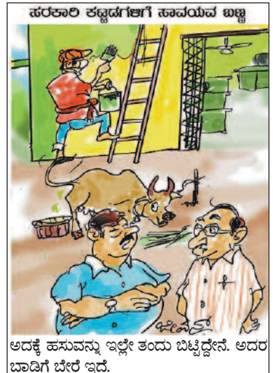
ಅದಕ್ಕೆ ಹಸುವನ್ನು ಇಲ್ಲೇ ತಂದು ಬಿಟ್ಟಿದ್ದೇನೆ. ಅದರ ಬಾಡಿಗೆ ಬೇರೆ ಇದೆ.