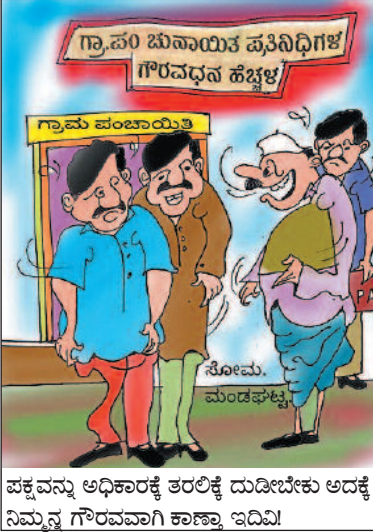
ಪಕ್ಕವನ್ನು ಅಧಿಕಾರಕ್ಕೆ ತರಲಿಕ್ಕೆ ದುಡೀಬೇಕು ಅದಕ್ಕೆ ನಿಮ್ಮನ್ನ ಗೌರವವಾಗಿ ಕಾಣ್ತಾ ಇದಿವಿ!