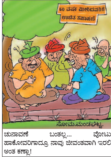
ಚುನಾವಣೆ ಬಂತಲ್ಲ... ವೋಟು ಹಾಕೋವರಿಗಾದ್ರೂ ನಾವು ಜೀವಂತವಾಗಿ ಇರಲಿ ಅಂತ ಕಣ್ಣಾ!