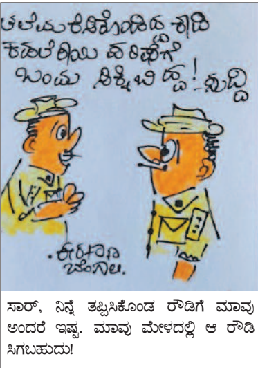
ಸಾರ್, ನಿನ್ನೆ ತಪ್ಪಿಸಿಕೊಂಡ ರೌಡಿಗೇ ಮಾವು ಅಂದರೆ ಇಷ್ಟ. ಮಾವು ಮೇಳದಲ್ಲಿ ಆ ರೌಡಿ ಸಿಗಬಹುದು!