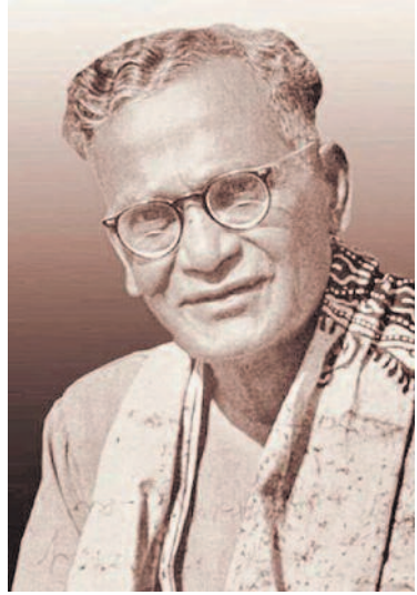
ಸಂವಿಧಾನದ ಮೂಲ ಸಂಪುಟಗಳಿಗೆ ಕಲಾತ್ಮಕ ಸ್ಪರ್ಶ ನೀಡಿದ ನಂದಲಾಲ್ ಬೋಸ್

ಏಳು ಮಂದಿ ಇದ್ದ ಸಂವಿಧಾನ ಕರಡು ಸಮಿತಿಯಲ್ಲಿ ಉಂಟಾದ ಎರಡುತೊಡರುಗಳ ನಡುವೆ ಬಾಬಾ ಸಾಹೇಬರ ನೇತೃತ್ವದಲ್ಲಿ, ಎರಡು ವರ್ಷ 11 ತಿಂಗಳು 17 ದಿನಗಳಷ್ಟು ಸುದೀರ್ಘ ಅವಧಿಯಲ್ಲಿ ವಿಶ್ವದ ಅತಿ ದೊಡ್ಡ ಲಿಖಿತ ಸಂವಿಧಾನ ರಚನೆಗೊಂಡಿತು. ಒಟ್ಟು 365 ವಿಧಿಗಳ, 25 ಪ್ರತ್ಯೇಕ ಭಾಗಗಳಲ್ಲಿ ರೂಪಿತವಾದ ಸಂವಿಧಾನ ಸಂಪುಟದಲ್ಲಿ, ದೇಶದ ಚರಿತ್ರೆಯ ಅಪೂರ್ವ ಬಿಂಬಗಳಿಗೆ ಅವಕಾಶ ಇರಬೇಕೆನ್ನುವುದು