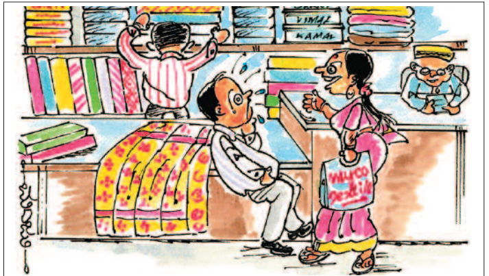
2000 ರೂಪಾಯಿ ನೋಟಿಗೆ ಚೆಲ್ಲರ ಇಲ್ಲವಂತೇರಿ, ಇನ್ನೊಂದು ಸೀರೆ ತಗೊಂಡು ಬಿಡೋಣರಿ!