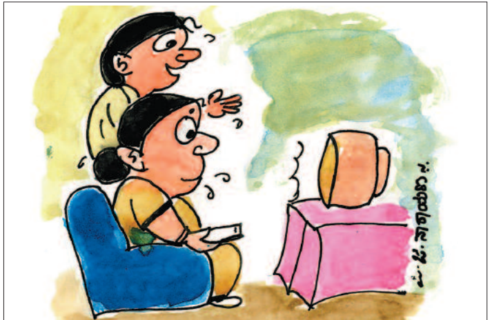
ಈ ಧಾರಾವಾಹಿನಲ್ಲಿ ಬರ್ತಾ ಇರೋದು... ಕಾಲ್ಪನಿಕ ಅಂತ ಇದೆ... ಆದರೆ ಎಲ್ಲಾ ನಮ್ಮ ಮನೆಯ ಕಥೆನೇ... ಇದೆಯಲ್ಲಾ...!