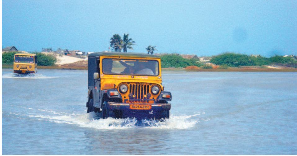
ಪ್ರವಾಸಿಗರನ್ನು ಕರೆತರುವ ವಾಹನ