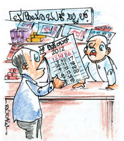
ಡಿಸೆಂಬರ್ 21ಕ್ಕೆ ಪ್ರಳಯ ಅಲ್ಲವಾ ಸಾರ್? ಅದಕ್ಕೆ ಅಲ್ಲಿವರೆಗೆ ಮಾತ್ರ ಪ್ರಿಂಟ್ ಹಾಕಿದ್ದು!