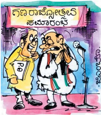
ಸಾರ್.. ಕೈ ಜೋಡಿಸಿಕೊಂಡೇ ಭಾಷಣ ಮಾಡ್ತಿದ್ದೀರಲ್ಲ, ಇದೇನೂ ಪ್ರಚಾರ ಸಭೆ ಅಲ್ಲ... ಚುನಾವಣೆ ಇನ್ನೂ ನಿರ್ಧಾರವಾಗಿಲ್ಲ!