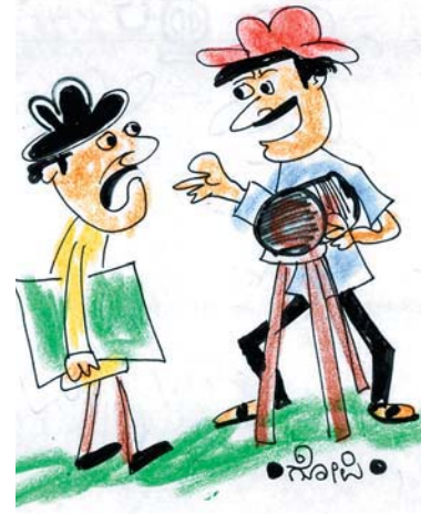
ಬುದ್ಧಿವಂತ, ಗುಣವಂತ, ರೂಪವಂತ ಫಿಲ್ ಆಯಿತು... ಇನ್ನು ಹಣವಂತ ಮಾಡೋಣ. ರೆಡ್ಡಿಗಳ ಕತೆ ಇದೆಯಲ್ಲ!