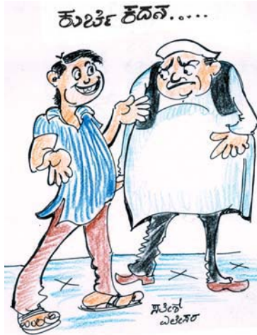
ಹೇಗೂ ಸಾಮೂಹಿಕ ನಾಯಕತ್ವ ಪ್ರತಿಪಾದಿಸ್ತಾ ಇದ್ದೀರಾ... ಮುಖ್ಯಮಂತ್ರಿ ಪದವಿಯನ್ನೂ ಸಾಮೂಹಿಕ ಮಾಡಿ...