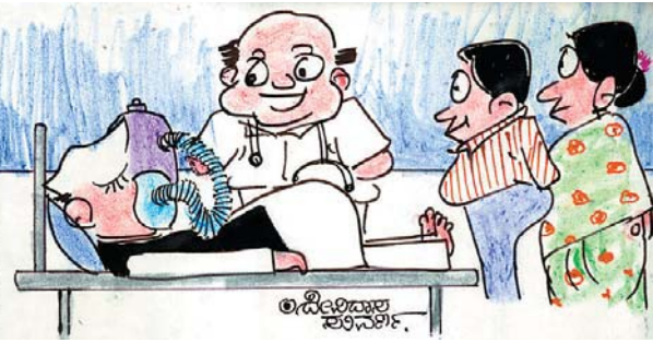
ಏಳಿ ಸಾರ್... ಏಳಿ... ಮುಖದಿಂದ ಅದನ್ನು ಕಳಚಿ ಬಂದವರು ಪೊಲೀಸರಲ್ಲ. ನಿಮ್ಮವರೆ