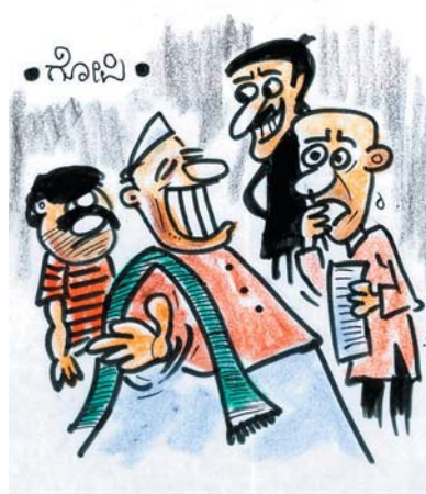
ಮುಂದಿನ ಚುನಾವಣೆಗೆ ಸ್ಪರ್ಧಿಸುವುದು ಗ್ಯಾರಂಟಿ... ಯಾವ ಪಕ್ಷ ದಿಂದ ಟಿಕೆಟ್ ಸಿಗುವುದೆಂದು ನೋಡಬೇಕು..