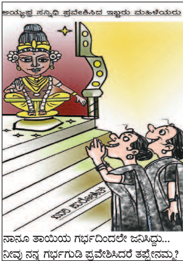
ನಾನೂ ತಾಯಿಯ ಗರ್ಭದಿಂದಲೇ ಜನಿಸಿದ್ದು... ನೀವು ನನ್ನ ಗರ್ಭಗುಡಿ ಪ್ರವೇಶಿಸಿದರೆ ತಪ್ಪೇನಮ್ಮ?