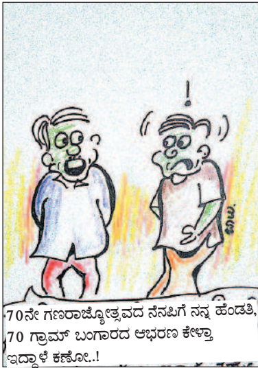
70ನೇ ಗಣರಾಜ್ಯೋತ್ಸವದ ನೆನಪಿಗೆ ನನ್ನ ಹೆಂಡತಿ, 70 ಗ್ರಾಮ್ ಬಂಗಾರದ ಆಭರಣ ಕೇಳುತ್ತಾ ಇದ್ದಾಳೆ ಕಣೋ..!