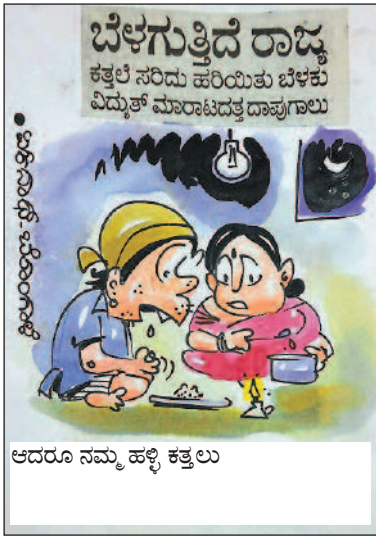
ಆದರೂ ನಮ್ಮ ಹಳ್ಳಿ ಕತ್ತಲು