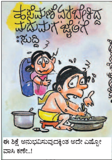
ಈ ಶಿಕ್ಷೆ ಅನುಭವಿಸುವುದಕ್ಕಿಂತ ಅದೇ ಎಷ್ಟೋ ವಾಸ ಕಣೋ..!