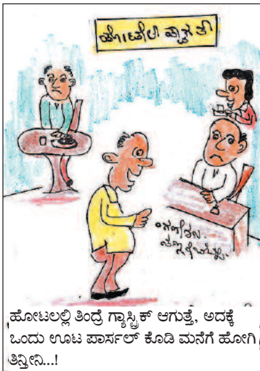
ಹೋಟಲಲ್ಲಿ ತಿಂದ ಗ್ಯಾಸ್ಟ್ರಿಕ್ ಆಗುತ್ತೆ, ಅದಕ್ಕೆ ಒಂದು ಊಟ ಪಾರ್ಸಲ್ ಕೊಡಿ ಮನೆಗೆ ಹೋಗಿ ತಿನ್ನೀನಿ...!