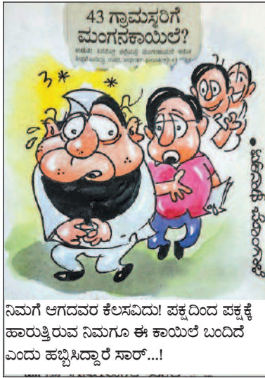
ನಿಮಗೆ ಆಗದವರ ಕೆಲಸವಿದು! ಪಕ್ಕದಿಂದ ಪಕ್ಕಕ್ಕೆ ಹಾರುತ್ತಿರುವ ನಿಮಗೂ ಈ ಕಾಯಿಲೆ ಬಂದಿದೆ ಎಂದು ಹಬ್ಬಿಸಿದ್ದಾರೆ ಸಾರ್...!