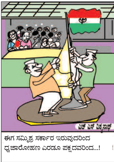
ಈಗ ಸಮಿಶ್ರ ಸರ್ಕಾರ ಇರುವುದರಿಂದ ದ್ವಜಾರೋಹಣ ಎರಡೂ ಪಕ್ಕದವರಿಂದ...!