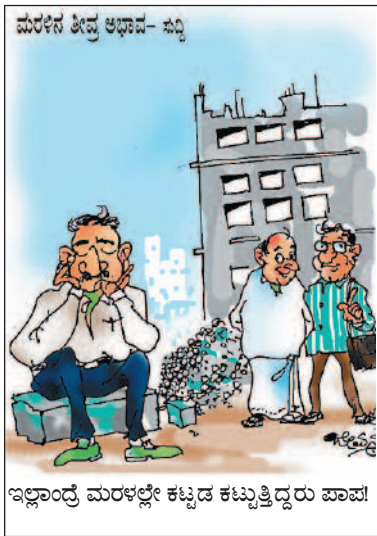
ಇಲ್ಲವೆಂದ್ರೆ ಮರಳಲ್ಲೇ ಕಟ್ಟಡ ಕಟ್ಟುತ್ತಿದ್ದರು ಪಾಪ!