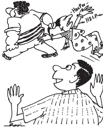
ಓಹೋ.. ಅತ್ಯಾಚಾರ.. ಮೋಂಬತ್ತಿ ತರಬೇಕು.. ಹೆಚ್ಚಿ ಪ್ರತಿಭಟಿಸಬೇಕು!