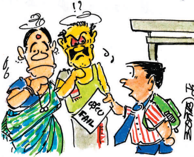
ಪಪ್ಪಾ.. ಮಮಿ.. ಈಗಲಾದು ತಿಳ್ಳೊಳ್ಳಿ.. ನಾನು ಫೇಲಾಗಿಧರ ಕಾರಣ!

ಕಪಿಲ್ ಸಿಬಲ್ ಪ್ರತಿಪಾದನ ಶಿಕ್ಷಕರು ಸಾಕಷ್ಟು ಸುಶಿಕ್ಷಿತರಾಗಿಲ್ಲ ಹೊಸದಿಲ್ಲಿ ಶಿಕ್ಷಣ ಸಮುದಾಯವು ಸಾಕಷ್ಟು ಸುಶಿಕ್ಷಿತರಾಗಿಲ್ಲ