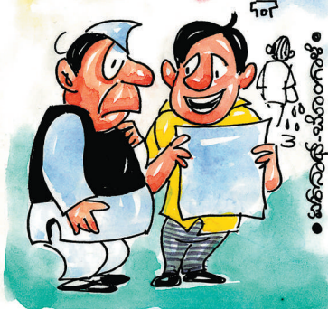
ಜನ ಕಂಡ- ಕಂಡಲ್ಲಿ ಗೋಡೆಗಳಿಗೆ ಕಾಲೆತ್ತುತಾರಲ್ಲಾ ಅಲ್ಲಿ ಈ ಯಂತ್ರಗಳನ್ನ ಇಡಿಸಿದ್ ಇಡೀ ಬೆಂಗಳೂರಿಗೇ ಬೇಕಾದಷ್ಟು ವಿದ್ಯುತ್ ಉತ್ಪಾದಿಸಬಹುದು ಸಾರ್!

ಪೂಕ್ರದಿಂದ ವಿಸ್ತೃಷ್ಟಕ್ರ ಲಕ್ಷ್ಮವಿಷ್ಣುವ ಜನರೊಬರ