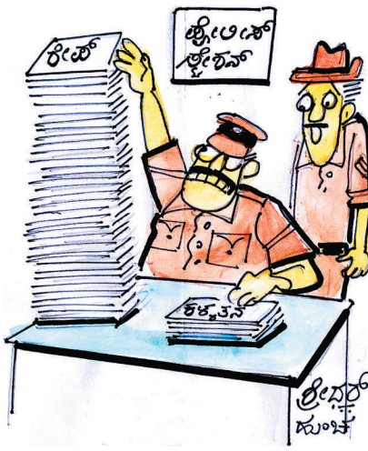
ಅವೆಲ್ಲಾ ರೇಪ್ ಕಂಪ್ಲೆಂಟ್‌ಗಳು, ಇವು ಮಾತ್ರ ಕಳ್ಳತನ- ದರೋಡೆ ಕಂಪ್ಲೆಂಟ್‌ಗಳು...