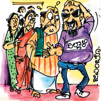
ಮನೆಯಲ್ಲಿ ಇಷ್ಟೊಂದು 'ಕೆಡ್ಡಿ' ಇಷ್ಟೊಂದು ಬಡವಾ ಅಂತಿದ್ದೀರಲ್ಲ ಸಾರ್!