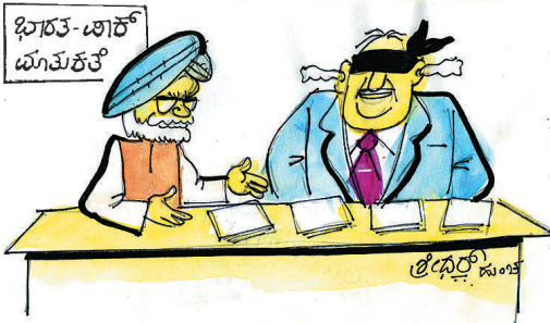
ನಮ್ಮ ನೆಲದಲ್ಲಿ ಭಯೋತ್ಪಾದನೆಗೆ ನಿಮ್ಮ ದೇಶದ ಕುಮ್ಮಕ್ಕಿನ ಬಗ್ಗೆ ಇಷ್ಟೆಲ್ಲ ಸಾಕ್ಷ್ಯಗಳನ್ನು ನಿಮ್ಮ ಮುಂದಿರಿಸಿದರೂ ಮೌನವಾಗಿರಲಿಲ್ಲ...?