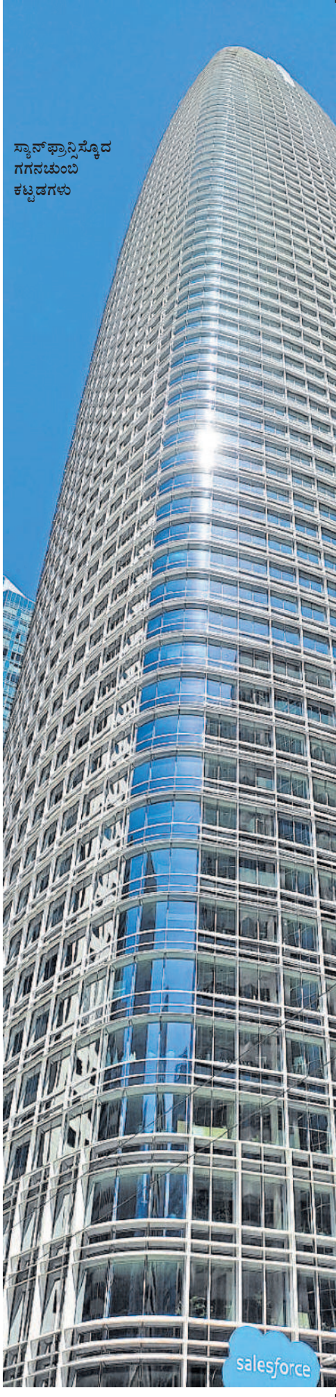
ಸ್ಯಾನ್ ಫ್ರಾನ್ಸಿಸ್ಕೋದ ಗಗನಚುಂಬಿ ಕಟ್ಟಡಗಳು