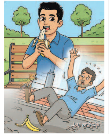
ಸದೃಢವಾದ ಕೋಲು ಕೈಗೆ ಬರುತ್ತದೆ.