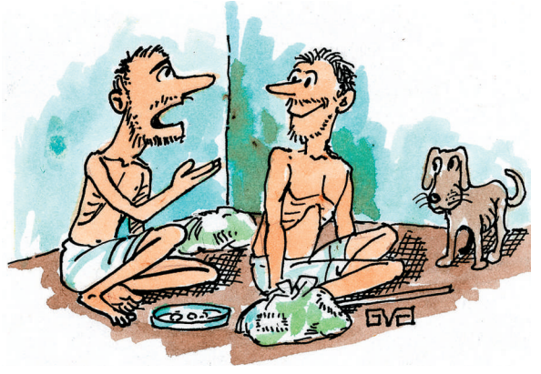
ಈ ಪರಿ ವಿಮಾನ ಅಪಘಾತಗಳು ಆಗುತ್ತಿರೋದನ್ನು ನೋಡಿದರೆ ಜೀವಮಾನದಲ್ಲೇ ವಿಮಾನ ಹತ್ತಬಾರದು ಅಂತ ತೀರ್ಮಾನಿಸಿದ್ದೇನೆ...!