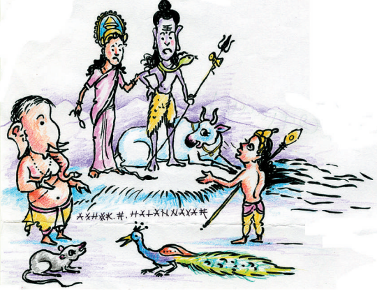
ಅಪ್ಪಾಜಿ ಭೂಲೋಕದಲ್ಲಿ ನಿಮ್ಮ ಹಸರು ಬಳಸಿ ತೆಲುಗಿನಲ್ಲಿ 'ಲಿಂಗ' ಕನ್ನಡದಲ್ಲಿ 'ಶಿವಲಿಂಗ' 'ಗಣಪ' ಅಂತ ಸಿನಿಮಾ ಮಾಡುತ್ತಿದ್ದಾರೆ..!