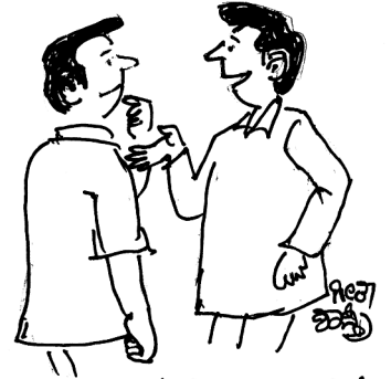
ವಿಜ್ಞಾನವು ವ್ಯತ್ಯಾಸ ನೋಡಿ. ಹೀದಿಸ ಪ್ರಧಾನಿಗಳು ಮಾತು ಅಡ್ಡಲಲ್ಲ ಖಂಡಿಸ ಪ್ರಧಾನಿಗಳು ಮಾತಾಡೋರು ಇಡ್ಡಲಲ್ಲ ಇಲ್ಲ !!