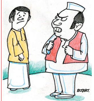
ಸದನದಲ್ಲಿ ನಿನ್ನೆ ಮಾಡುವಹಾಗಿಲ್ಲ, ಮೊಬೈಲ್ ಬಳಸುವ ಹಾಗಿಲ್ಲ, ಮತ್ತೆ ಹೇಂಗಿೇ ನಾವು ಜನಸೇವೆ ಮಾಡೋದು?