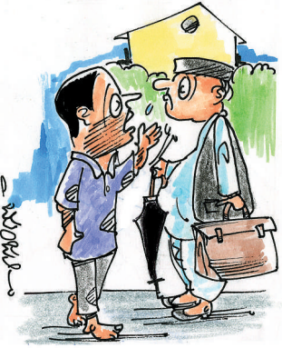
ನೋಡಿ ನಿಮ್ಮ ಸಾಲವನ್ನೇನು ತಿಂದು ಹೋಗುವುದಿಲ್ಲ... ವಿದೇಶದಲ್ಲಿ ಇಟ್ಟಿರೋ ಕಪ್ಪುಹಣಿ ಬಂದ ಮೇಲೆ ಸರ್ಕಾರ ನೀಡೋ ನೆರವಿನಲ್ಲಿ ತೀರಿಸ್ತೀನಿ!