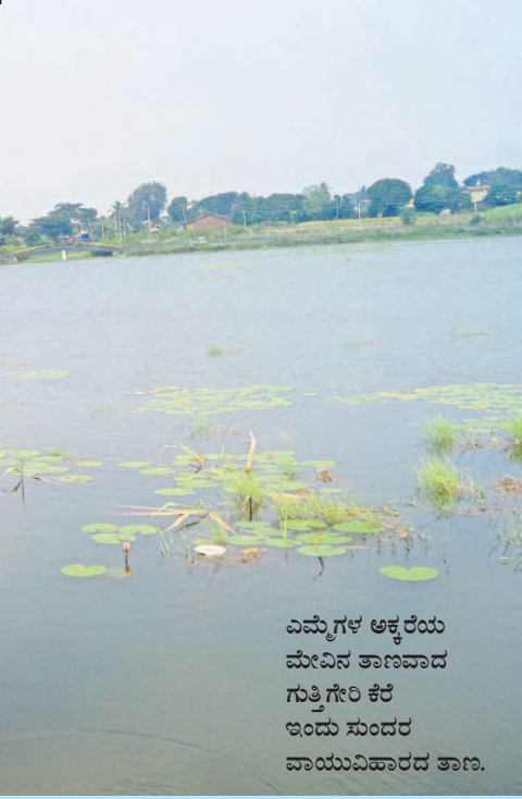
ಎಮ್ಮೆಗಳ ಅಕ್ಕರೆಯ ಮೇವಿನ ತಾಣವಾದ ಗುತ್ತಿಗೆರಿ ಕೆರೆ ಇಂದು ಸುಂದರ ವಾಯುವಿಹಾರದ ತಾಣ.

ಹಿಂದೆ ಬಹುತೇಕ ಭೂಮಿಯಲ್ಲಿ ಮಳೆ ಆಶ್ರಿತ ಭತ್ತ ಬೆಳೆಯಲಾಗುತ್ತಿತ್ತು. ವಾಣಿಜ್ಯ ಬೆಳೆಯಾಗಿ ಹತ್ತಿ 80ರ ದಶಕದಲ್ಲಿ ಆಗಮಿಸಿತು. ಸಕ್ಕರೆ ಕಾರ್ಖಾನೆ ಆರಂಭವಾದ ಹತ್ತು ವರ್ಷದ ಹಿಂದೆ ಕಬ್ಬು ವಾಣಿಜ್ಯ ಬೆಳೆಯಾಗಿ ಹಿಗ್ಗಿತು. ಇಲ್ಲಿನ ಹೊಳೆ ಹಳ್ಳಿಗಳಿಗೆ ಚಿಕ್ಕಪುಟ್ಟ ಬಾಂದಾರಗಳಿದ್ದುದು ಬಿಟ್ಟರೆ ಬೇರೆ ನೀರಾವರಿ ಯೋಜನೆಯಿಲ್ಲ. ಸುಮಾರು 9000 ಹೆಕ್ಟೇರ್ ಪ್ರದೇಶದಲ್ಲಿ ಕಬ್ಬು ಬೆಳೆಯುವ ಇಲ್ಲಿ ನೀರಾವರಿಗೆ ಕೂಳವೆ ಬಾವಿ ಅನಿವಾರ್ಯ. 2-3 ಹೆಕ್ಟೇರ್ ಪ್ರದೇಶಕ್ಕೆ ಒಂದರಂತೆ ಸಾವಿರಾರು ಕೊಳವೆ ಬಾವಿಗಳನ್ನು ರೈತರೇ ಕೊರೆಸಿದ್ದಾರೆ. ಕೆರೆ ಅಚ್ಚುಕಟ್ಟಿನಲ್ಲಿರುವ ಇವುಗಳಲ್ಲಿ ಮೊದಲು 100-150 ಅಡಿಗೇ ದೊರೆಯುತ್ತಿತ್ತು. ನಂತರ 350-400 ಅಡಿಗೇ ಕುಸಿದಿತ್ತು. ಉತ್ತರ ಕನ್ನಡ ಜಿಲ್ಲೆಯಲ್ಲಿಯೇ ಅತಿಹೆಚ್ಚು ಅಂತರ್ಜಲ ಕುಸಿತದ ಪ್ರದೇಶವೆಂದರೆ ಹಳಿಯಾಳ. ಈಗ ಕೆರೆಯಲ್ಲಿ ನೀರು ನಿಂತಿದ್ದರಿಂದ ಕೃಷಿ ಕುಡಿಯುವ ನೀರಿಗೆ ಅನುಕೂಲವಾಗಿದೆ. ರೈತರ ಆರ್ಥಿಕತೆಯಲ್ಲಿ ಬದಲಾವಣೆ ಕಾಣಿಸುತ್ತಿದೆ. ಕೃಷಿಗೆ ಪೂರಕ ಹೈನುಗಾರಿಕೆ ಬೆಳೆಯುತ್ತಿದೆ.