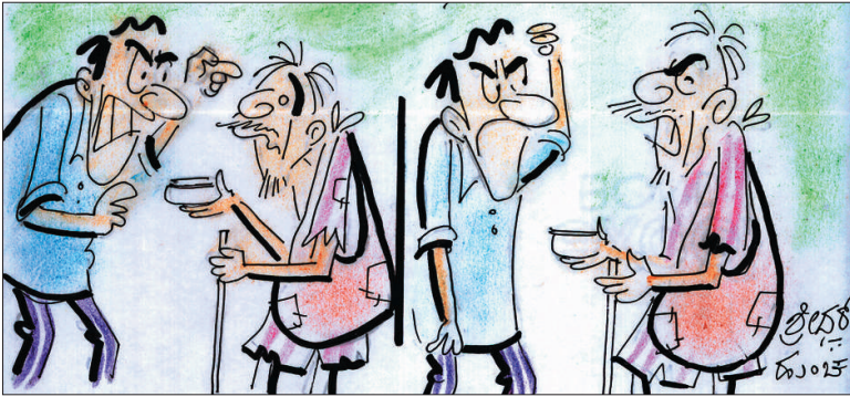
ನಿಂಗೆ ಭಿಕ್ಷೆ ಬೇಡೋಕೆ ನಾಚಿಕೆ ಆಗಲ್ವೇನೋ..? ಮುಖ್ಯಮಂತ್ರಿಗಳೇ ಬೇಡ್ತಾರೆ ನಾನೇನು ಬಿಡಿ..!