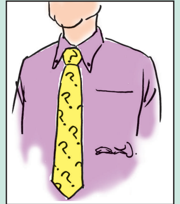
ಮಾನ ಉಳಿಸಿಕೊಳ್ಳಲು ಕೌಪೀನ, ಮರ್ಯಾದೆ ಹೆಚ್ಚಿಸಿಕೊಳ್ಳಲು ಕಂಠಕೌಪೀನ(ಟೈ)!