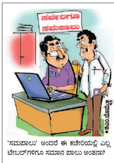
'ಸಮಪಾಲು' ಅಂದರೆ ಈ ಕಚೇರಿಯಲ್ಲಿ ಎಲ್ಲ ಟೆಬಲ್‌ಗಳಿಗೂ ಸಮಾನ ಪಾಲು ಅಂತನಾ?