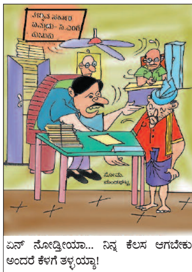
ಏನ್ ನೋಡ್ತೀಯಾ... ನಿನ್ನ ಕೆಲಸ ಆಗಬೇಕು ಅಂದರೆ ಕೆಳಗೆ ತಳ್ಳಿಯ್ಯಾ!