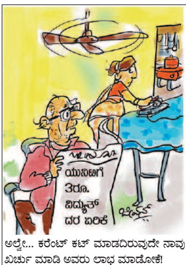
ಅಲ್ಲೇ... ಕರೆಂಟ್ ಕಟ್ ಮಾಡದಿರುವುದೇ ನಾವು ಖರ್ಚು ಮಾಡಿ ಅವರು ಲಾಭ ಮಾಡೋಕೆ!