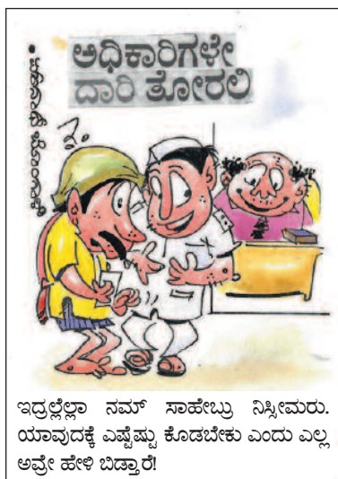
ಇದ್ರಲ್ಲೆಲ್ಲಾ ನಮ್ ಸಾಹೇಬ್ರು ನಿಸ್ತೀಮರು. ಯಾವುದಕ್ಕೆ ಎಷ್ಟೆಷ್ಟು ಕೊಡಬೇಕು ಎಂದು ಎಲ್ಲ ಅವೇ ಹೇಳಿ ಬಿಡ್ತಾರೆ!