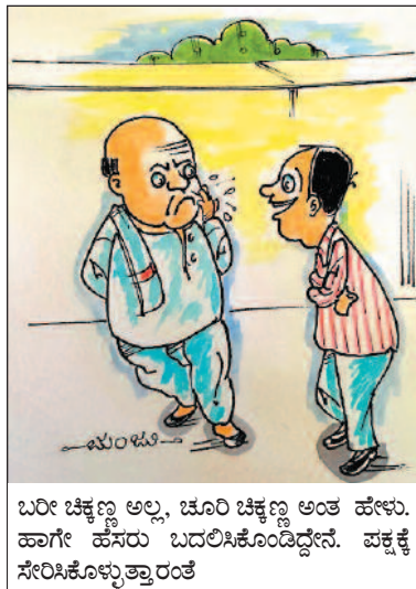
ಬರೀ ಚೆಕ್ಕಣ್ಣ ಅಲ್ಲ, ಚೂರಿ ಚೆಕ್ಕಣ್ಣ ಅಂತ ಹೇಳು. ಹಾಗೇ ಹೆಸರು ಬದಲಿಸಿಕೊಂಡಿದ್ದೇನೆ. ಪಕ್ಕಕ್ಕೆ ಸೇರಿಸಿಕೊಳ್ಳುತ್ತಾರಂತೆ