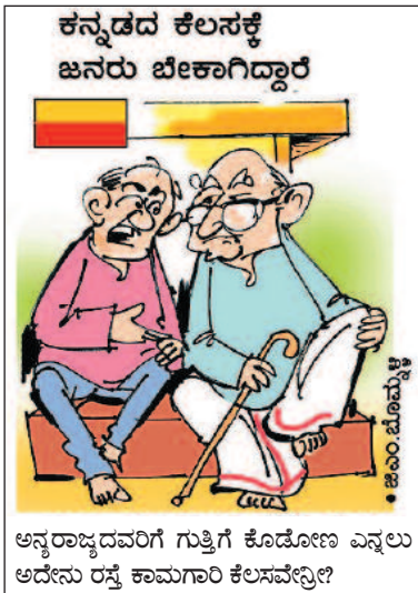
ಅನ್ಯರಾಜ್ಯದವರಿಗೆ ಗುತ್ತಿಗೆ ಕೊಡೋಣ ಎನ್ನಲು ಅದೇನು ರಸ್ತೆ ಕಾಮಗಾರಿ ಕೆಲಸವೇನೀ?