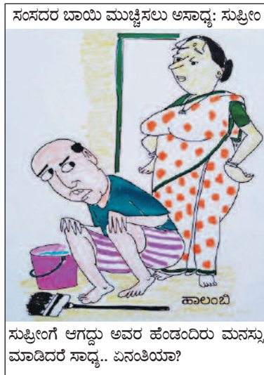
ಸುಪ್ರೀಂಗೆ ಆಗದ್ದು ಅವರ ಹೆಂಡಂದಿರು ಮನಸ್ಸು ಮಾಡಿದರೆ ಸಾಧ್ಯ.. ಏನಂತಿಯಾ?