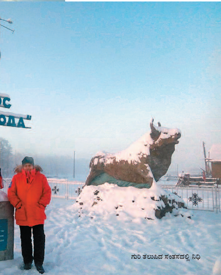
ಗುರಿ ತಲುಪಿದ ಸಂತಸದಲ್ಲಿ ನಿಧಿ

2007ರಲ್ಲಿ ಬೆಂಗಳೂರಿನಿಂದ ಲಡಾಖ್ ಗೆ ಚತುಷ್ಟಕ ವಾಹನವನ್ನು ಡ್ರೈವ್ ಮಾಡಿದರು. ಆ ದಾರಿ ಮತ್ತು ವಾಹನ ಯಾತ್ರೆ ಹೊಸದಲ್ಲವಾದರೂ ಹೆಣ್ಣೊಬ್ಬಳು ಮಾಡಿದ ಸಾಧನೆಯನ್ನು 'ಆಫ್ ರೋಡ್ ಡ್ರೈವರ್' ಗಳ ಪ್ರಪಂಚ