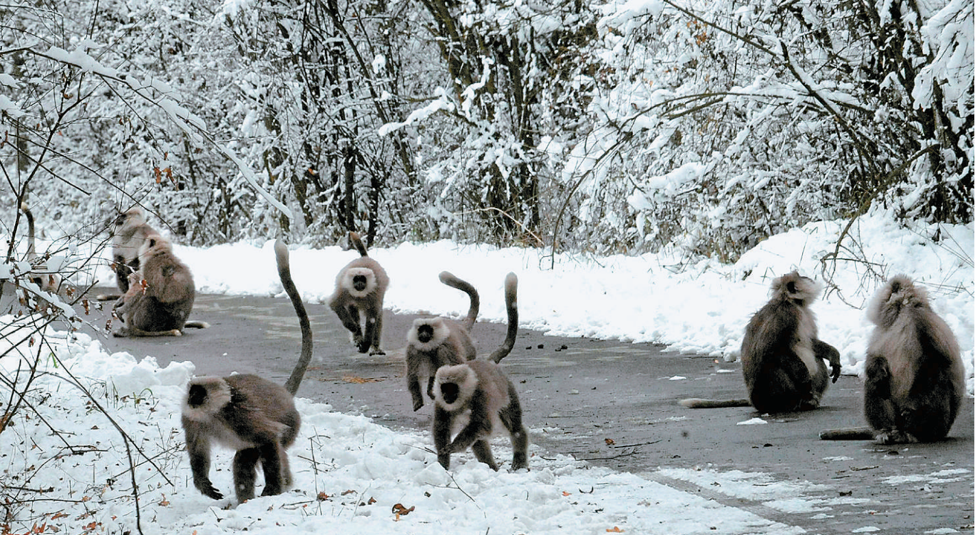
ಕಾಶ್ಮೀರದ ಶ್ರೀನಗರ ಹೊರವಲಯದಲ್ಲಿರುವ ದಾಪಿಗಾಂ ಅಭಯಾರಣ್ಯದಲ್ಲಿ ಹಿವಾದ ಮೇಲೆ ಲಂಗೂರ್ ಕೋತಿಗಳ ಓಟ