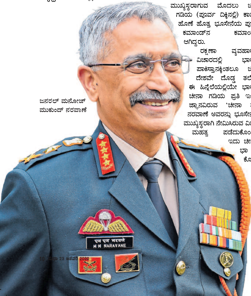
ಜನರಲ್ ಮನೋಜ್ ಮುಕುಂದ್ ನರವಾಣೆ

ಭವಿಷ್ಯದ ಸೂಪರ್‌ಪವರ್‌ಗಳಾದ ಈ ಎರಡೂ ದೇಶಗಳ ನಡುವೆ ಗಡಿ ವಿವಾದ ಇನ್ನೂ ಜೀವಂತ. ತೆರೆಯ ಮೇಲೆ ಕಾಣುವಂತೆ ಗುದ್ದಾಟ ಕಡಿಮೆಯಿದ್ದರೂ, ತೆರೆಮರೆಯ ಮುಸುಕಿನ ಗುದ್ದಾಟ ಮತ್ತು ಅಪನಂಬಿಕೆ ಎರಡೂ ದೇಶಗಳ ನಡುವೆ ಇದೆ. ಅಂಡಮಾನ್ ಸಮೀಪದ