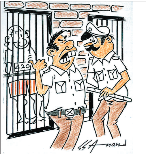
ಆ ಫೋನ್ ಟೆಂಟಿ, ಬೇಕೂ ಅಂತ್ ಸಿಕ್ಕಿ ಬಿದ್ದು ಬರೋಕೆ ಶುರು ಮಾಡಿದ್ದಾನೆ ಸಾರ್.. ಇಲ್ಲಿ ಕೊಡೋ ಊಟ ಸೋಗಾಸಾಗಿರುತ್ತಂತೆ!