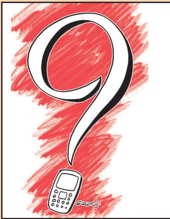
ಮಾನವನಿಗೂ, ದಾನವನಿಗೂ ನವ ಶುಭಸಂಖ್ಯೆಯೆಂಬ ನಂಬಿಕೆ!