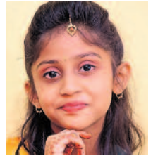
4ನೇ ತರಗತಿ, ಕೇಂದ್ರೀಯ ವಿದ್ಯಾಲಯ, ಸಿ.ವಿ. ರಾಮನ್ ನಗರ, ಬೆಂಗಳೂರು