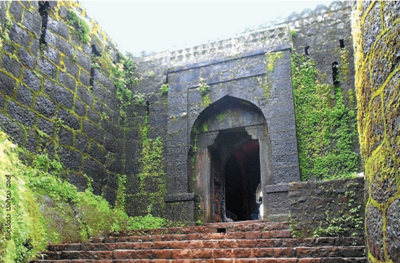
ಕೋಟೆಯ ಬಾಗಿಲು ವಾಡೆ