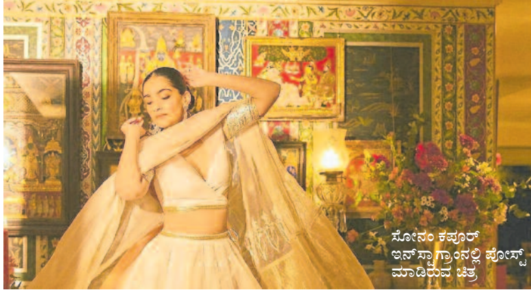
ಸೋನಂ ಕಪೂರ್ ಇನ್‌ಸ್ಟಾಗ್ರಾಂನಲ್ಲಿ ಪೋಸ್ಟ್ ಮಾಡಿರುವ ಚಿತ್ರ

2022ರಲ್ಲಿ ಸೋನಂ ತಾಯಿಯಾದ ಮೇಲೆ ತಮ್ಮ ಹಳೆಯ ದೇಹಾಕಾರ ಪಡೆದುಕೊಂಡು, ಹಿಂದಿನ ಸ್ಥಿತಿಗೆ ಮರಳಲು 16 ವಾರಗಳು ಬೇಕಾದವು. ಯಾವುದೇ ಕ್ಯಾಷ್ ಡಯೆಟ್ ಕೋರ್ಸ್ ಮಾಡದೆ, ಜಿಮ್‌ನಲ್ಲಿ ವಿಪರೀತ ಬೆವರು ಹರಿಸದೆ ಅವರು ಮತ್ತೆ ನಾಯಕಿಗೆ ಇರುವಂತಹದ್ದೇ ದೇಹಾಕಾರ ಪಡೆದುಕೊಂಡಿರುವುದಕ್ಕೆ ಅವರ ಫೋಟೋಗಳು ಕನ್ನಡಿ ಹಿಡಿಯುತ್ತವೆ. ಅಷ್ಟೇ ಅಲ್ಲ, ಅವರ ಫ್ಯಾಷನ್ ಸ್ಟೇಟ್‌ಮೆಂಟ್ ಕೂಡ ಅವುಗಳಲ್ಲಿ ಇದೆ. ಚೆಂದವಾಗಿ ಅಲಂಕಾರ ಮಾಡಿಕೊಳ್ಳುವ ನಾಜೂಕು ನಟಿಯರ ಸಾಲಿನಲ್ಲಿ ಸೋನಂ ಕೂಡ ಪ್ರಮುಖರು. ಅವರ ಫ್ಯಾಷನ್ ಅಭಿರುಚಿಯನ್ನು ವಾರಗೆಯ ಎಷ್ಟೋ ಮಂದಿ