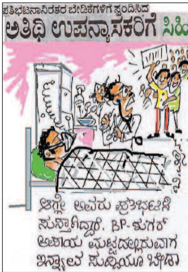
ಇಂಗ್ಲೆಂಡ್ ಅವರು ಪ್ರತಿಭಟನೆಗೆ ಸುಸ್ತಾಗಿದ್ದಾರೆ. BP-ಕುಗರ್ ಅಜಿಯ ಉಚ್ಚದಲ್ಲರುವಾಗ ಇನ್ನಷ್ಟೇ ಸುಸ್ತಿಯೂ ಬೇಡ