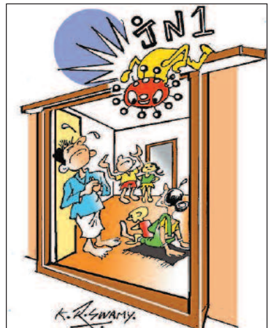
ನಾನು ಕೊರೊನಾ... ತಮ್ಮ ಮನೇಲಿ ಎಲ್ಲ ಆರೋಗ್ಯವೇ?