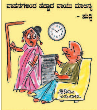
ಪಕ್ಕದ ಮನೆಯವರು ಹೊಸ ಕಾರ್ ತಂದಿದ್ದಾರೆ. ಮನೆ ಮುಂದೆ ಅದನ್ನು ನಿಲ್ಲಿಸಲು ಆ ಮರವನ್ನು ಕಡಿದಿದ್ದಾರೆ!