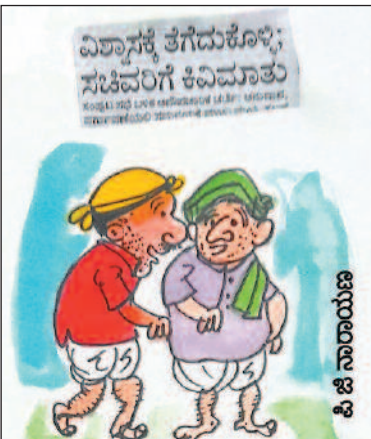
ನಮ್ಮನ್ನು ವಿಶ್ವಾಸಕ್ಕೆ ತೆಗೆದುಕೊಳ್ಳುವುದು ಐದು ವರ್ಷಕ್ಕೊಮ್ಮೆ ಮಾತ್ರ!