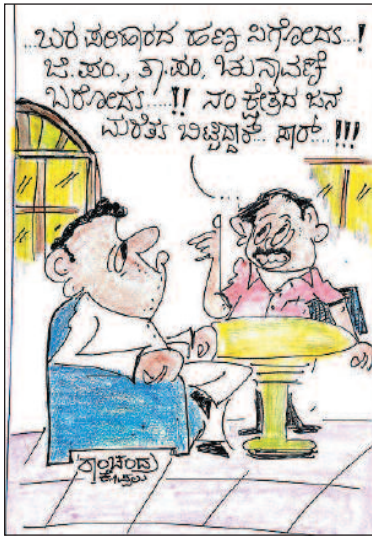
...ಬರ ಪರಿಹಾರ ಹಣ್ಣು ವಿಗೋಷ್ಯ!! ಬಿ.ಪಂ., ತ್ರ.ಪಂ. ಇವುಗಳಿಗೆ ಬಿರೋಷ್ಯ!!! ಸಂಕ್ಷೇಪ ಭನ ಮರತು ಬಿಟ್ಟುಕೊಳ್ಳೋಣ!!