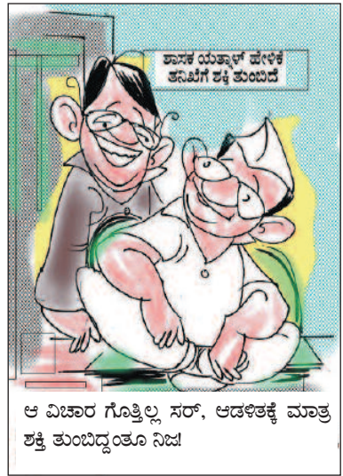
ಆ ವಿಚಾರ ಗೊತ್ತಿಲ್ಲ ಸರ್, ಅಡಳಿತಕ್ಕೆ ಮಾತ್ರ ಶಕ್ತಿ ತುಂಬಿದ್ದಂತೂ ನಿಜ!