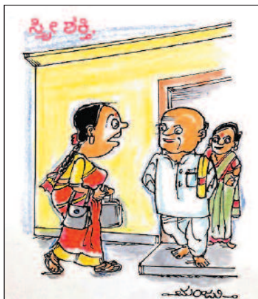
ಅವರಿಗೆ ಬಸ್ ಹತ್ತುವುದಕ್ಕೆ ಅವಕಾಶ ಆಗಲೇ ಇಲ್ಲ. ನಡೆದುಕೊಂಡೇ ಬರ್ತಿದ್ದಾರೆ!