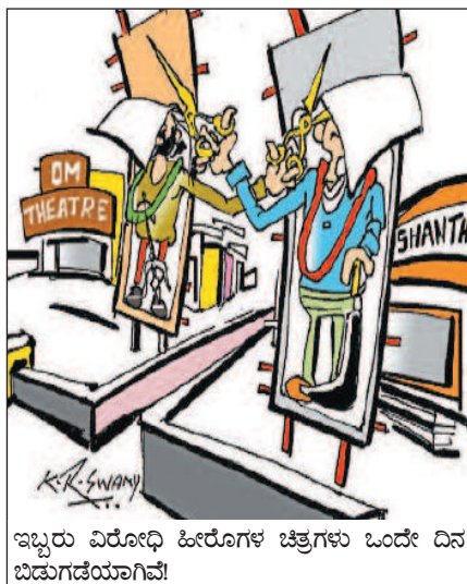
ಇಬ್ಬರು ವಿರೋಧಿ ಹೀರೋಗಳ ಚಿತ್ರಗಳು ಒಂದೇ ದಿನ ಬಿಡುಗಡೆಯಾಗಿವೆ!