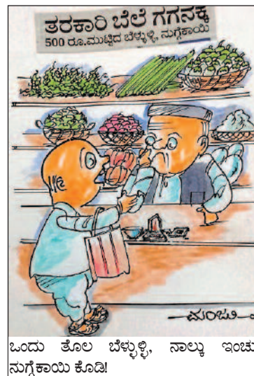
ಒಂದು ತೊಲ ಬೆಳ್ಳುಳ್ಳಿ, ನಾಲ್ಕು ಇಂಚು ಮಗ್ಗಕಾಯಿ ಕೊಡಿ!