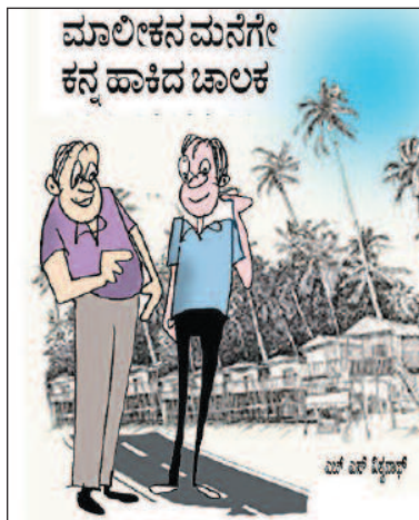
ವೃತ್ತಿಧರ್ಮ ಮುಖ್ಯ. ಭೇದ ಭಾವ ಸಲ್ಲದು ಎಂಬುದು ಕಳ್ಳನ ಧರ್ಮವೂ ಇರಬಹುದು!