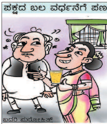
ಮೊದಲು ಈ ಜ್ಯೂಸ್ ಕುಡಿದು ಬಲವಾಗಿ ನಂತರ ಪಕ್ಷದ ಬಲವರ್ಧನೆ ಮಾಡುವಿರಂತೆ!