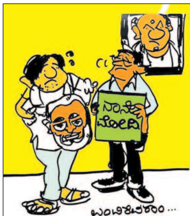
ಈ ಬೋರ್ಡ್ ಒಂದೇ ಸಾಕಾಗಲ್ಲ ಕಣ್ಣೇ. ನಮ್ಮ ಕಾರ್ಯಕರ್ತರಿಗೆ ಮೋದೀಜಿ ಮುಖವಾಡದ ಅವಶ್ಯಕತೆಯೂ ಇದೆ!