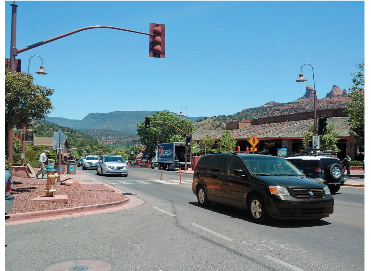
ಶ್ರೆಬ್ಲಿ ಹಿಲ್ ರೋಡ್