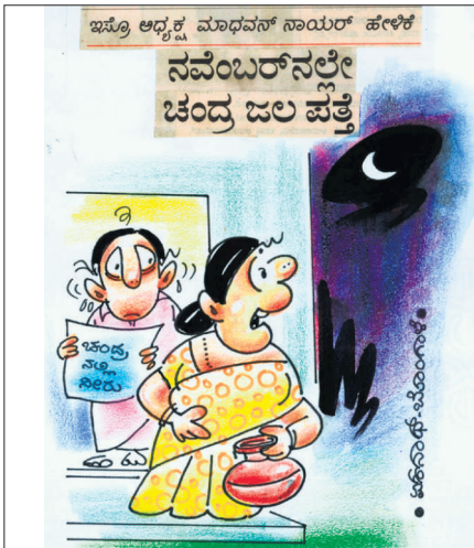
ಬೆಳಿಗ್ಗೆ 'ನಳ' ಬರದೇ ಮನೇಲಿ ಒಂದು ತೊಟ್ಟು ನೀರಿಲ್ಲ! ಅದ್ಲೆ ನಿಮ್ಮ ಕೈಯಲ್ಲಿ ಎಲ್ಲಿಂದ ನೀರು ತರಿಸೋದು ಅಂತ ಯೋಚಿಸ್ತೆ ದೀನಿ!