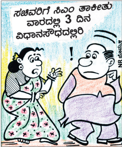
ಅಂದೆ, ಉಳಿದ 4 ದಿನ ಬೇಕಾಬಿಟ್ಟಿ ತಿರುಗೋದಲ್ಲಾ.. ಸ್ವಲ್ಪ ಮನೆ ಕಡೆಗೂ ಗಮನ ಇರಲಿ ರೀ..