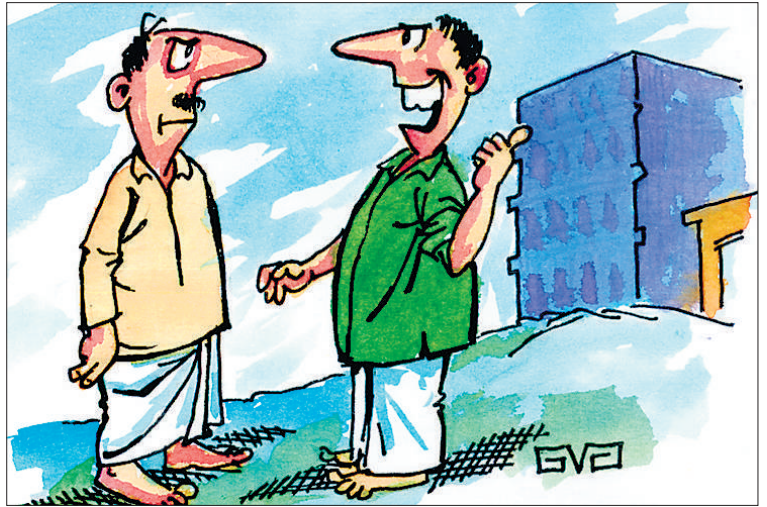
ಹಿಂದೆ ಬರಗಾಲ ಪೀಡಿತ ಕಾಮಗಾರಿಯಲ್ಲಿ ಈ ಕಟ್ಟಡ ಅರ್ಧ ಕಟ್ಟಿದ. ಈಗ ಪ್ರವಾಹ ಸಂತ್ರಸ್ತ ಕಾಮಗಾರಿಯಲ್ಲಿ ಪೂರ್ಣ ಗೊಳಿಸೋಣಾ ಅಂತ..!