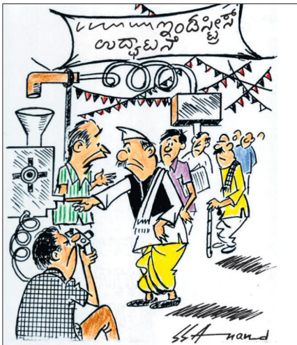
ಸ್ವಲ್ಪ ಹೊತ್ತು ಬಿಟ್ಟು ಸ್ವಿಚ್ ಒತ್ತಿ ಸಾರ್.. ಕರೆಂಟ್ ಹೋಯ್ತು!