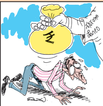
ಡೋಂಟ್ ವರಿ; ಕಡೆಯಲ್ಲಿ ನರ್ಸಿಂಗ್ ಹೋಲುವವರು, ಅಪರಕರ್ಮಿಗಳು ನಿಮ್ಮ ಹೊರೆ ಇಳಿಸುತ್ತಾರೆ.