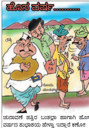
ಚುನಾವಣೆ ಹತ್ತಿರ ಬಂತಲ್ಲಾ ಹಾಗಾಗಿ ಹೊಸ ವರ್ಷದ ಶುಭಾಶಯ ಹೇಳುತ್ತಾ ಇದ್ದಾರೆ ಕಣೋ!