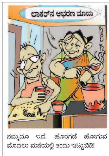
ನಮ್ಮದೂ ಇದೆ. ಹೊರಗಡೆ ಹೋಗುವ ಮೊದಲು ಮನೆಯಲ್ಲಿ ತಂದು ಇಟ್ಟುಬಿಡಿ!