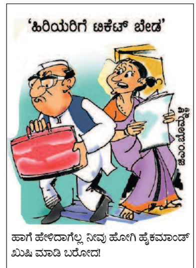
'ಹಿರಿಯರಿಗೆ ಟಿಕೆಟ್ ಬೇಡ' ಹಾಗೆ ಹೇಳಿದಾಗೆಲ್ಲ ನಿನ್ನ ಹೋಗಿ ಹೈಕಮಾಂಡ್ ಮಿಷಿ ಮಾಡಿ ಬರೋದ!