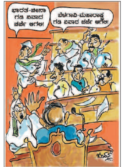
ಭಾರತ-ಜೀನಾ ಗಡಿ ಏವಾದ ಪರ್ಜೆ ಆಗಲಿ! ಪೆಲಗಾವಿ-ಮಹಾರಾಷ್ಟ್ರ ಗಡಿ ಏವಾದ ಪರ್ಜೆ ಆಗಲಿ!