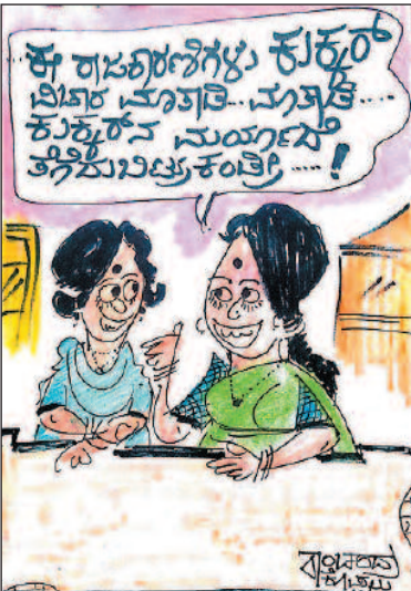
ಈ ರಾಜಕೀಯಿಗಳು ಕುಕ್ಕೂ... ಲಿಕ್ಕೂ... ಮೂಕ್ಕಿ... ಕುಕ್ಕೂ... ನುಯ್ಯೂ... ತಗ್ಗುಬಿಟ್ಟುಕೊತ್ತಿ...!