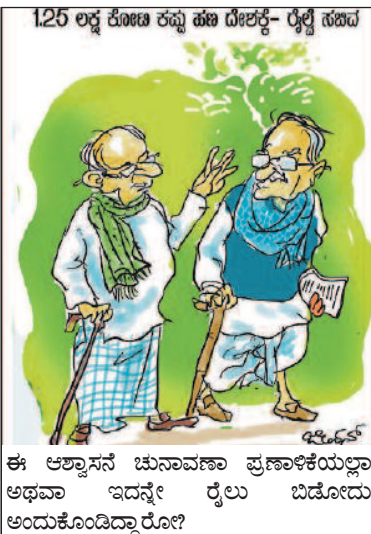
125 ಲಕ್ಷ ಕೋಟಿ ರಫ್ತು ಹಣ ದೇಶಕ್ಕೆ- ರೈಲ್ವೆ ಸಹವ ಈ ಆಶ್ವಾಸನೆ ಚುನಾವಣಾ ಪ್ರಣಾಳಿಕೆಯಲ್ಲಾ ಅಥವಾ ಇದನ್ನೇ ರೈಲು ಬಿಡೋದು ಅಂದುಕೊಂಡಿದ್ದಾರೋ?