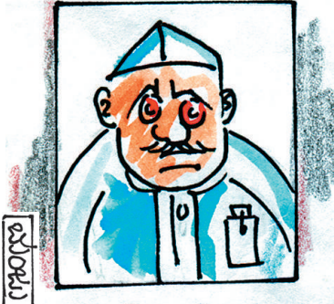
ನಿಮ್ಮ ಅಗಲಿಕೆಯಿಂದ ಜನರಲ್ಲಿ ಸುಖ, ಶಾಂತಿ ನೆಲೆಸಿ ನಮ್ಮ ದಿಯಿಂದ ಜೀವನ ನಡೆಸುತ್ತಿದ್ದಾರೆ. ನಿಮ್ಮ ನೆನಪು ನಿರಂತರ... -ಇತಿ ನಾಗರಿಕರು