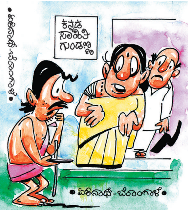
ಅದೇನು..? 'ಅಮ್ಮಾ.. ತಾಯಿ.. ಭಿಕ್ಷೆ ಹಾಕಿ' ಅಂತ ಅವಲಕ್ಷಣವಾಗಿ ಕೂಗಿಯೋ? 'ಮೇಡಂ ಭಿಕ್ಷೆ ಹಾಕಿ ಪ್ಲೀಸ್' ಅಂತ ಲಕ್ಷಣವಾಗಿ ಕೂಗೋಕೇ ಬರಲ್ಲಾ?