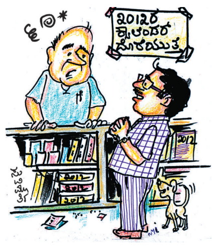
ಅದ್ರಲ್ಲಿ ಪ್ರಳಯ ಮತ್ತು ಡಿಸೆಂಬರ್ ತಿಂಗಳು ಇಲ್ಲ ಇರೋ ಕ್ಯಾಲೆಂಡರ್ ಇದ್ದೆ ಕೂಡಿ ಸರ್..!