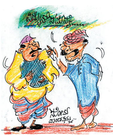
ನೋಡಿ ಸ್ವಾಮಿ ಈಗ್ಗೆ ಹೇಳ್ತಾ ಇದೀನಿ.. ಮೊಬೈಲ್ ಚಾರ್ಜ್ ಮಾಡ್ಲಿಕ್ಕೆ ಕರೆಂಟ್ ಇಲ್ಲ... ಮಗಳಿಗೆ ತೊಂದ್ರೆ ಆಗ್ತಾ ಇದೆ!