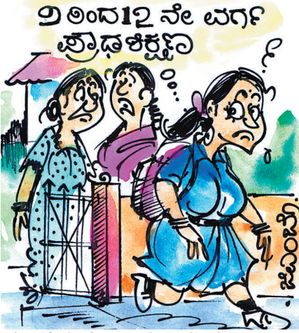
ಕೈಯಲ್ಲಿ ಮೊಬೈಲ್ ಇಲ್ಲದೇ ಕಾಲೇಜಿಗೆ ಹೋಗುವುದಿಲ್ಲ ಅಂತಿದ್ದು.. ಇನ್ನೂ ಎರಡು ವರ್ಷ ಆ ಚಿಂತೆ ಇಲ್ಲ ಕಣ್ರೀ..!