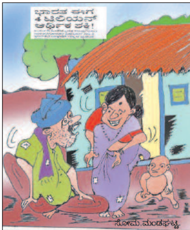
ರೀ ಇನ್ನುಂದೆ ನಾವು ಬಡವರು ಅಂತ ಹೇಳ್ತೀಬಾರರು ಅಲ್ಲಾ?