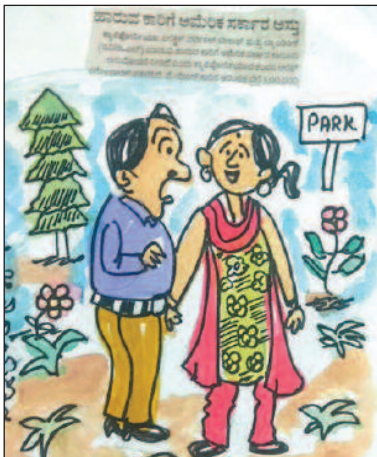
ನೀನು ಈ ಕಾರನ್ನು ತೆಗೆದುಕೊಂಡ್ರೆ ನಾವಿಬ್ಬರು ಅಂತರಿಕ್ಷದಲ್ಲಿ ಹಾರಾಡ್ತಾ ಸುತ್ತಾಡಬಹುದು!