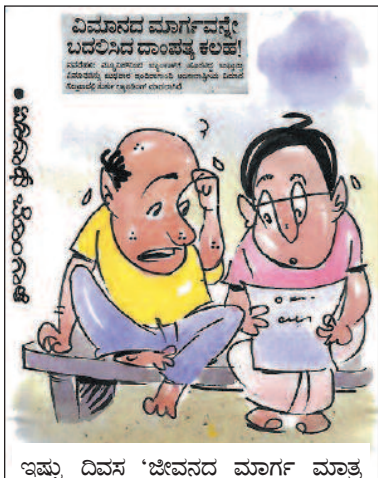
ಇಷ್ಟು ದಿವಸ 'ಜೀವನದ ಮಾರ್ಗ ಮಾತ್ರ ಬದಲಿಸುತ್ತೆ' ಅಂತ ತಿಳಿದ್ಕೊಂಡಿದ್ದಿ ಅಲ್ಲಾ?