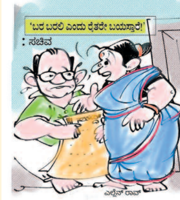
ಸಕ್ಕರೆ ಸಚಿವರ ಮಾತು ಸಕ್ಕರೆಯಂತೆ ಇರಲಿ ಅಂತ ಜನ ಬಯಸಾರೆ ಅಲ್ಲೇ...?

ಮಾಜಿ ಪ್ರೇಮಿಯು ಮದುವೆಗೆ ಹೋದ ಪ್ರೇಮನನ್ನು ಹುಡುಗಿಯ ತಂದೆ ಕೇಳಿದರು