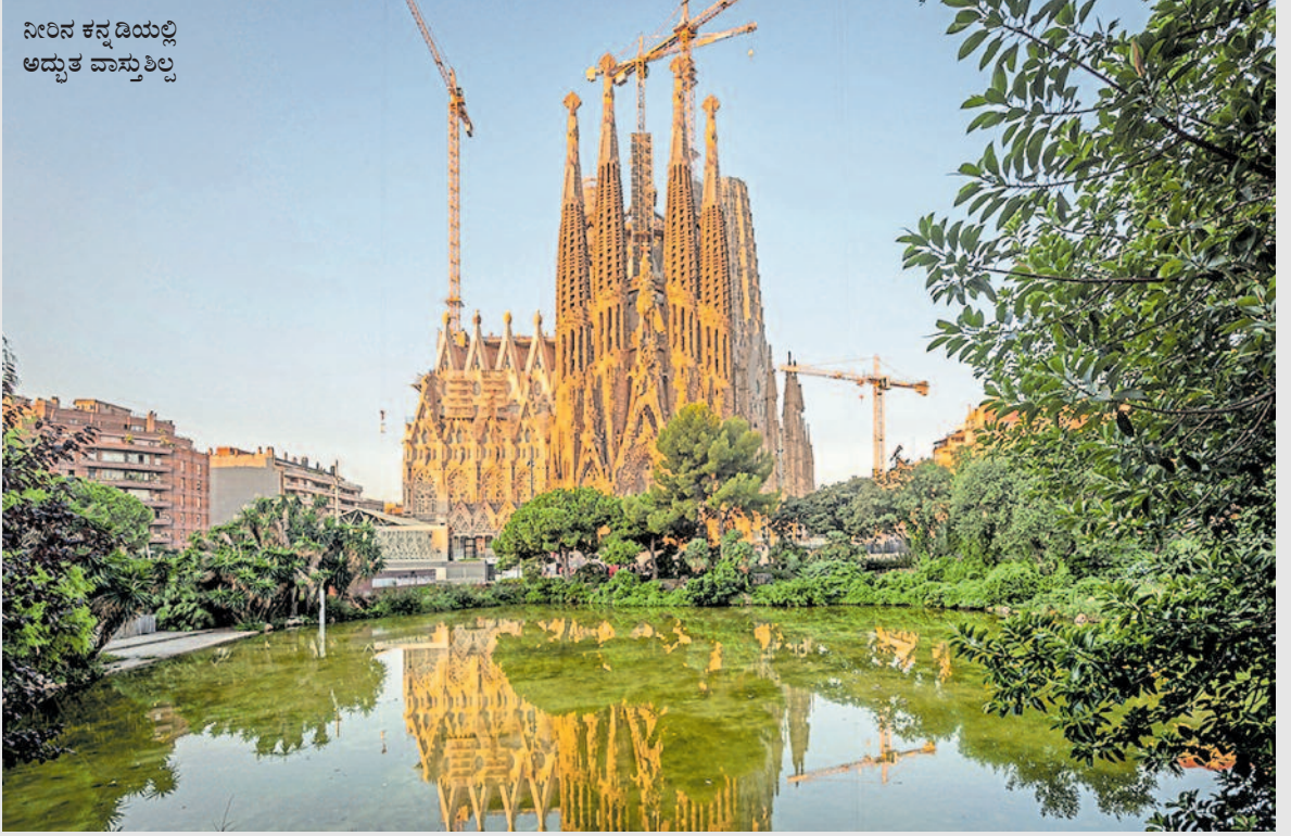
ನೀರಿನ ಕನ್ನಡಿಯಲ್ಲಿ ಅದ್ಭುತ ವಾಸ್ತುಶಿಲ್ಪ

ಸ್ಪೇನ್‌ನ 'ಲ ಸಗ್ರಾದ ಫೆಮಿಲಿಯ' ಜಗತ್ತನ್ನೆಲ್ಲ ವಾಸ್ತುಶಿಲ್ಪಗಳಲ್ಲೊಂದು. ಯುನೆಸ್ಕೋದ ವಿಶ್ವ ಪಾರಂಪರಿಕ ತಾಣಗಳಲ್ಲೊಂದಾದ ಈ ನಿರ್ಮಾಣ, ಸುಮಾರು ನೂರಾರು ವರ್ಷಗಳಿಂದ ನಡೆಯುತ್ತಲೇ ಇದೆ. ಈ ಅಪೂರ್ವ ವಾಸ್ತುಶಿಲ್ಪ ತನ್ನ ಅತ್ಯದ್ಭುತ ವಿನ್ಯಾಸ, ಸೌಂದರ್ಯ ಹಾಗೂ ಗಾಂಭೀರ್ಯದಿಂದ ನೋಡುಗರ ಮನಸೆಳೆಯುತ್ತದೆ.