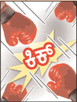
ಹಾಗೆ ಮಾಡಿದವರಿಗೆ ಲಿಕ್ವರ್ ಕೊಡುವ ಕಿಕ್ ಗಿಂತಲೂ ದೊಡ್ಡ ಕಿಕ್ ಸಾರ್ವಜನಿಕವಾಗಿ ದೊರೆತೀತು!