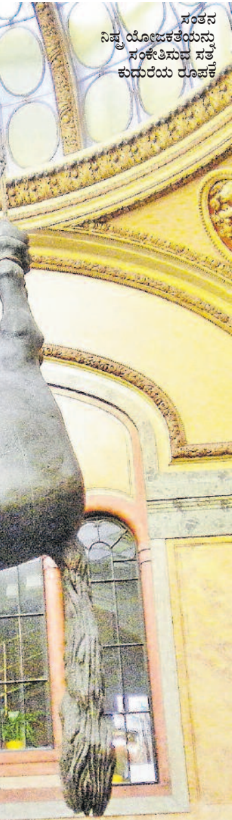
ಸಂತನ ನಿಷ್ಠೆಯೋಜಕತೆಯನ್ನು ಸಂಕೇತಿಸುವ ಸತ್ ಕುದುರೆಯ ರೂಪಕೆ

ಎದುರು ನಿಂತು, ಅಷ್ಟೇನೂ ಆಳವಿಲ್ಲದ ಕೊಳವೊಂದಕ್ಕೆ ಮೂತ್ರ ವಿಸರ್ಜನೆ ಮಾಡುತ್ತಿರುತ್ತವೆ. ಮೂತ್ರ ವಿಸರ್ಜಿಸುತ್ತಿರುವಾಗ, ಎರಡೂ ಕಲಾಕೃತಿಗಳ ಸೊಂಟ ಕುಣಿಯುತ್ತದೆ, ಲಿಂಗ ಮೇಲೆ ಕೆಳಗೆ ಚಲಿಸುತ್ತದೆ ಹಾಗೂ ನೀರಿನಿಂದ ಪ್ರಾಗ್ ನಿವಾಸಿಗಳ ಪ್ರಸಿದ್ಧ ಉಲ್ಲೇಖಗಳನ್ನು ಬರೆಯುತ್ತದೆ. ಆಳವಿಲ್ಲದ ಕೊಳ ಜೆಕ್ ಗಣರಾಜ್ಯದ ಪ್ರತೀಕ ಎನ್ನಲಾಗಿದ್ದು, ಪುರುಷರು ದೇಶದ ಮೇಲೆ ಮೂತ್ರ ವಿಸರ್ಜಿಸುತ್ತಿದ್ದಾರೆ ಎನ್ನುವ ಅರ್ಥವನ್ನು ಶಿಲ್ಪಿಗಳಿಗೆ ಹಚ್ಚಲಾಗಿದೆ.