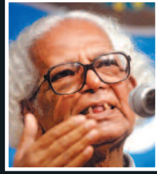
ಕವಿ ಅಕಬರ ಅಲಿ