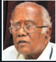
ಚಿತ್ರ ನಿರ್ದೇಶಕ ಗೀತಪ್ರಿಯ