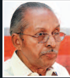
ಸಾಹಿತಿ ಓಎನ್‌ವಿ ಕುರುಪ್