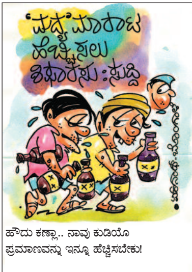
ಹೌದು ಕಣ್ಣಾ.. ನಾವು ಕುಡಿಯೋ ಪ್ರಮಾಣವನ್ನು ಇನ್ನೂ ಹೆಚ್ಚಿಸಬೇಕು!