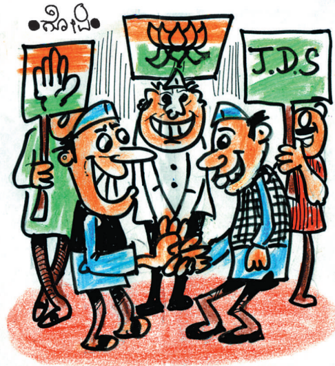
ಚಿತ್ರ: ವಿವಿಧ, ಚುನಾವಣೆ ಮುಗಿದ ಮೇಲೆ ಮಾಡೋಣ..