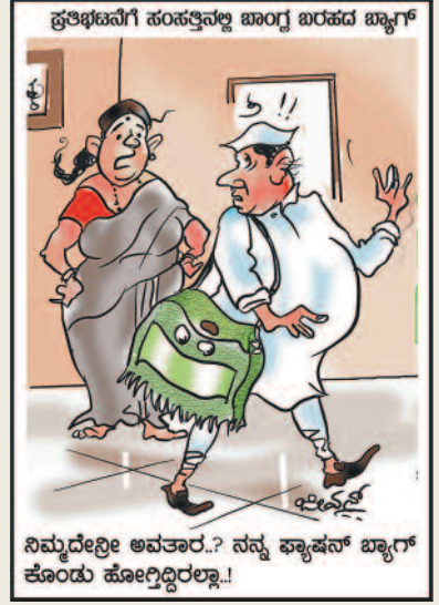
ನಿಮ್ಮದೇಗಿಂತ ಅವತಾರ..? ನನ್ನ ಫ್ಯಾಷನ್ ಖ್ಯಾತ್ ಕೊಂಡು ಹೋಗಿದ್ದೀರಲ್ಲಾ..!

ಅರವಿಂದ: ಕಿಟ್ಟು, ನಿಮ್ಮ ಮಗ ಇತ್ತೀಚೆಗೆ ಹಳೆಯ ಕಾದಂಬರಿಗಳನ್ನು ಓದಲು ಶುರು ಮಾಡಿದ್ದಾನಲ್ಲ? ಕಿಟ್ಟು: ಹೌದು, ಅವನಿಗೆ ಒಮ್ಮೆ ಹಳೆಯ ಕಾದಂಬರಿ ಪುಟದಲ್ಲಿ 500 ರೂಪಾಯಿ ಸಿಕ್ಕಿತಂತೆ.